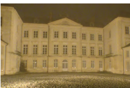
Le Palais illuminé