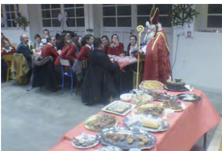
Saint Nicolas distribue les chocolats