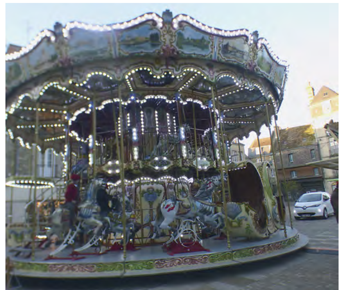
Tour de manège