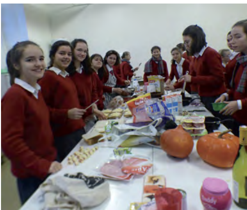
Préparation du dîner