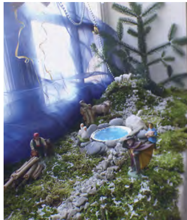
Crèche du réfectoire