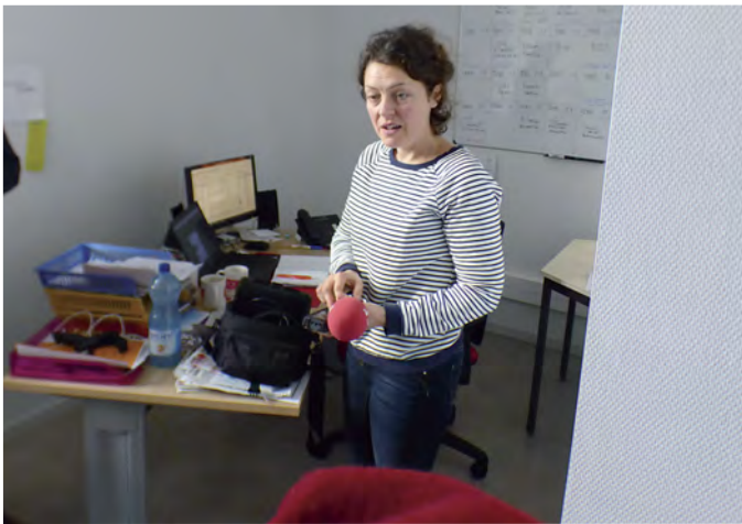
La journaliste de RCF dans son bureau