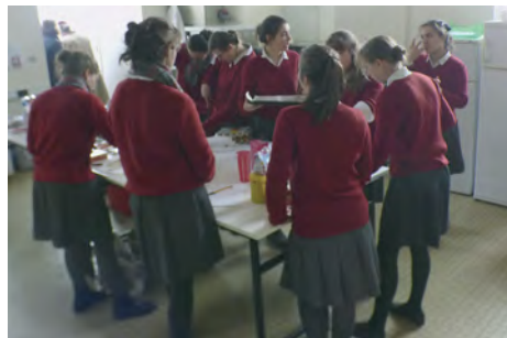
Toutes en cuisine