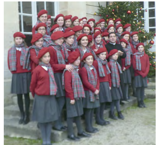
Photo de groupe avec M r l'abbé