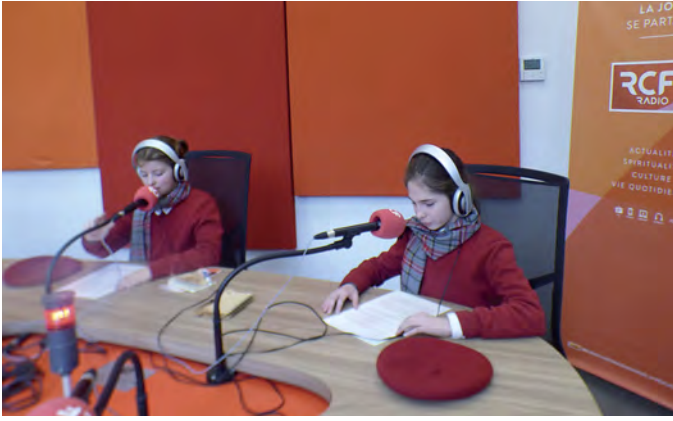
Enregistrement de l'émission