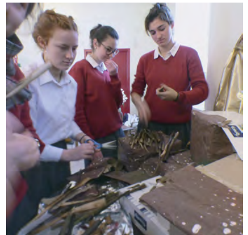
Préparation de la Crèche de l'accueil