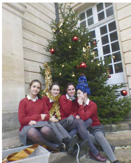
Décor du sapin ...