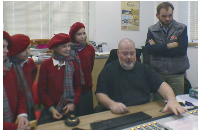
Le technicien à la régie radio